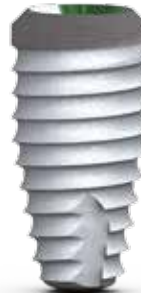
5.8mm Implantatkörper / 4.5 Prothetik-Plattform